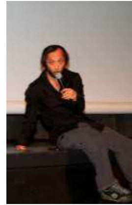
Catherine Destivelle Alpiniste et grimpeuse 2009